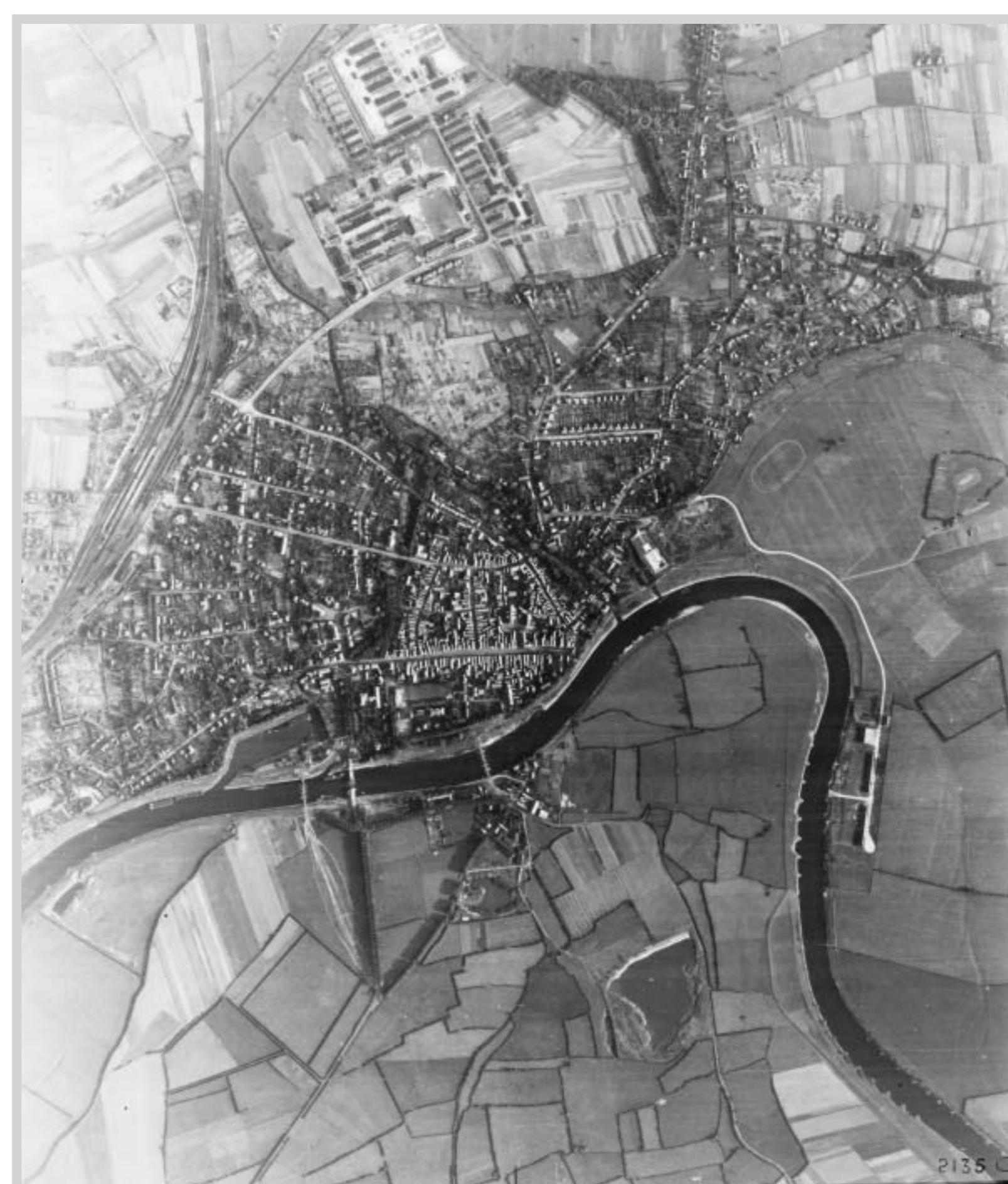
Luftaufnahme, Nienburg 10.10.1945: Im Stadtbild sind noch die Zerstörungen im Bahnhofsbereich zu erkennen.

Am 9. April 1945 besetzten kanadische und britische Truppen kampflos die Stadt Nienburg. Damit war für die Nienburger Bevölkerung der von Deutschland verursachte Zweite Weltkrieg zu Ende. Allein im heutigen Niedersachsen hatte der Zweite Weltkrieg 350 000 Zivilisten und Soldaten