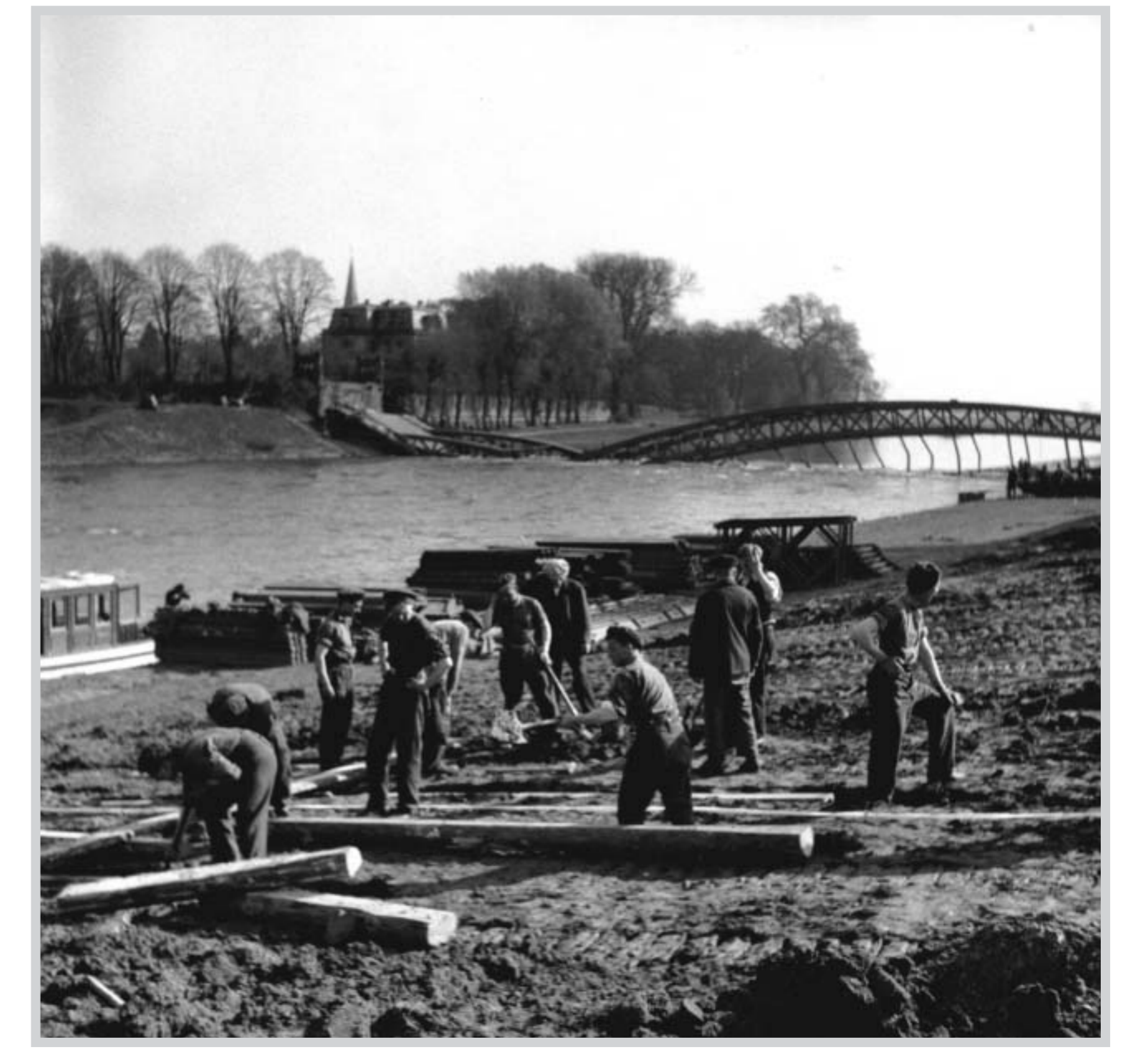
Britische Truppen errichten am 14. April 1945 eine provisorische Brücke über die Weser mit einer Tragfähigkeit von 40 t.

Die Luftschutzakten der Polizei Hannover verzeichneten neben der zerstörten Bahnhofshalle 27 schwer und 609 leicht beschädigte Wohngebäude im Umkreis des Bahnhofes. 41 Menschen wurden getötet, 74 erlitten Verletzungen. Zahlreiche Opfer dieses Angriffs sind auf dem Nordfriedhof beigesetzt, darunter etliche junge Menschen. In den folgenden Tagen zogen die in Nienburg verbliebenen deutschen Truppen ab. Eine Gruppe Nienburger Bürger unter Leitung von Bürgermeister Beims fuhr den anrückenden Alliierten entgegen und übergab die Stadt.